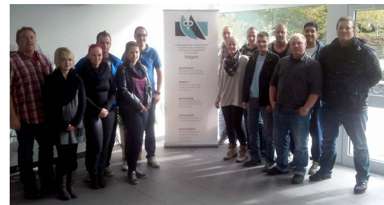
64. Soldatenlehrgang Verwaltungsfachangestellte

Fünf hauptamtliche Lehrkräfte, ca. 80 nebenamtliche Dozentinnen und Dozenten und eine leistungsfähige Institutsverwaltung bilden die Grundlage für eine erfolgreiche, praxisorientierte Aus- und Fortbildung im Öffentlichen Dienst. Mit dem Berufsförderungsdienst der Bundeswehr verbindet uns eine über 35-jährige erfolgreiche Zusammenarbeit bei der Durchführung der Lehrgänge.